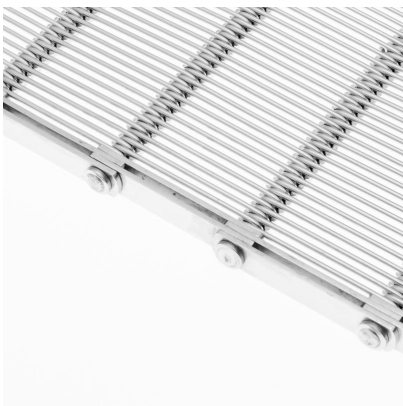
Banda metálica de malla gancho (CMG)